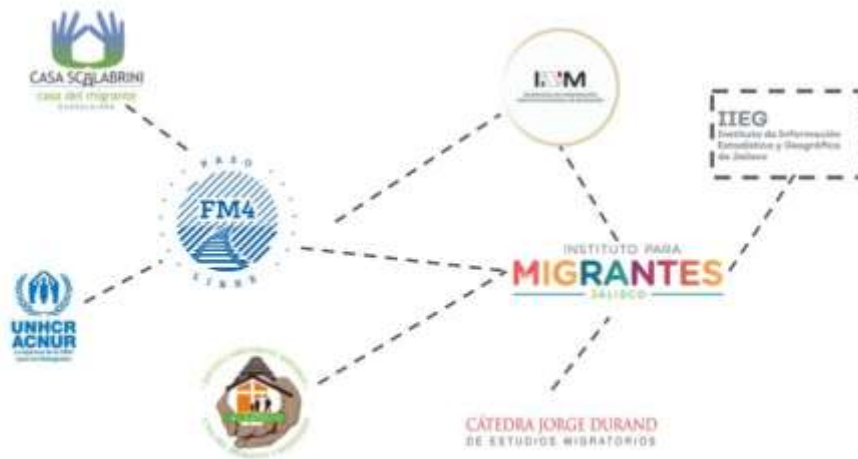
Cuadro 4. Diagrama de la Red de actores migratorios en Jalisco 2017

importancia de mantener una red local consolidada que permita que acciones como la integración del anuario se fortalezcan y participen en la esfera internacional. En el diagrama 3 se muestra la red de actores migratorios en Jalisco.