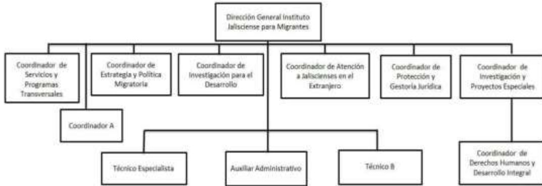
Cuadro 1. Organigrama del Instituto Jalisciense para los Migrantes 1

Fuente: Elaboración propia con base en el organigrama realizado para el Manual de Operaciones y Procedimientos del Instituto Jalisciense para los Migrantes, 2018.