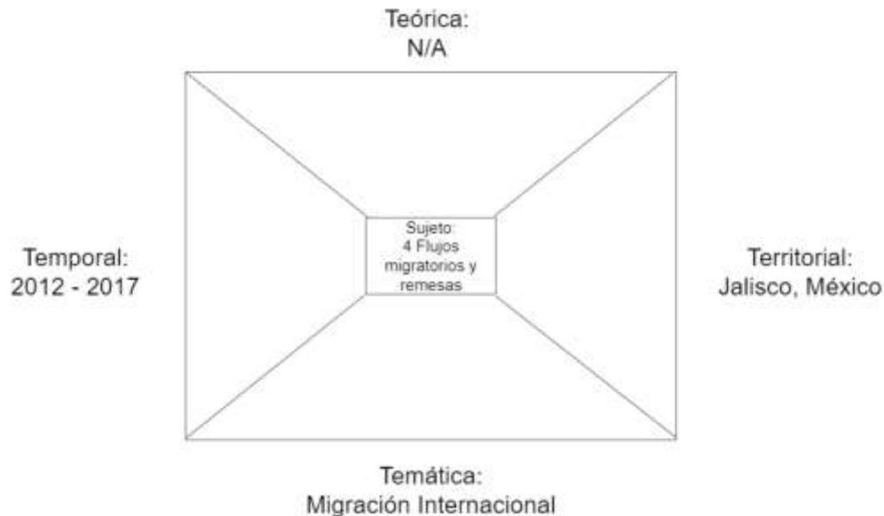
Cuadro 2. Diagrama de las coordenadas metodológicas generales del anuario de migración